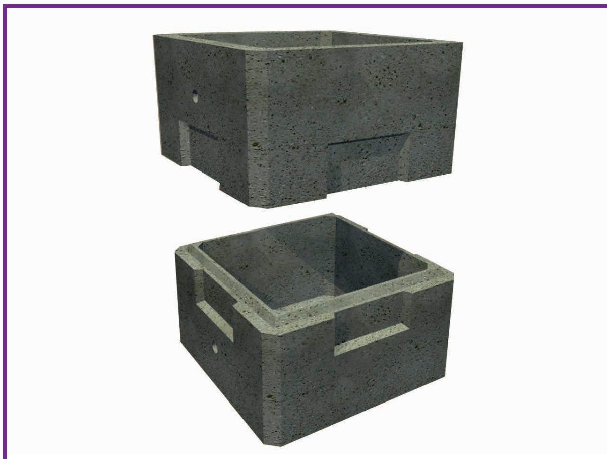
Modello con Attestato di Qualificazione Ministeriale

Pozzetti modulari per infrastrutture di reti di Telecomunicazioni, costituiti da un elemento di base ed uno di prolunga, entrambi di forma parallelepipedica.